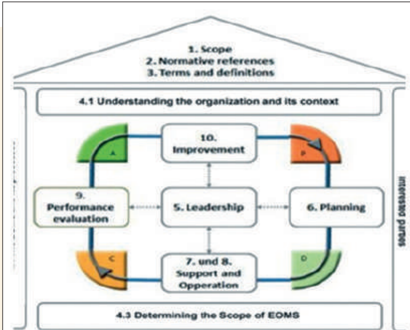
Figure: Representation of the structure of this International Standard in the PDCA cycle