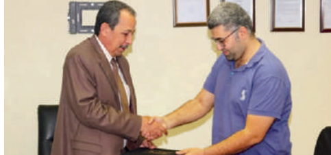
توقيع عقد التأهيل مع شركة فيروز الصناعية