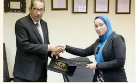
توقيع عقد التأهيل مع شركة ليكترو