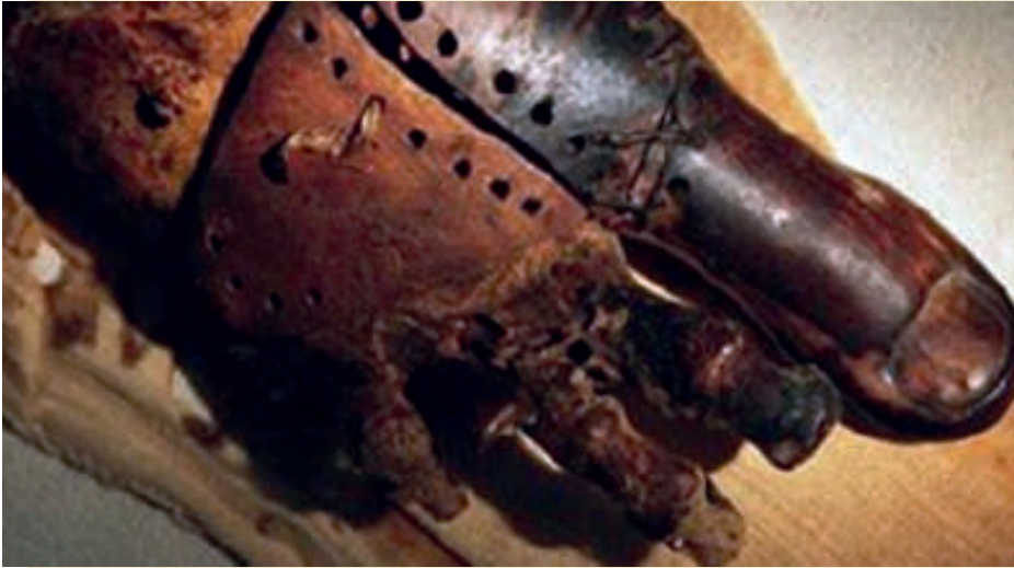
(اطراف صناعية فرعونية)

يمكن للعبقريّة أن تواتي بني البشر في أوقات غير متوقّعة، فخلال السطور التالية نلقي نظرة على سيرة بعض المخترعين الجسورين الذين أسهموا في تطوير التقنية الخاصة بابتكار أطراف صناعية تعويضية ودفع هذه التقنية إلى الأمام.